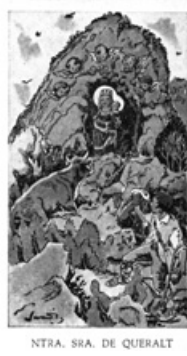
Queralt per Junceda