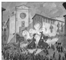
Lola Anglada, color

publicats: Magraneta , Taronges d'or , Contes de Paradís , Alicia en terra de meravelles , En Peret , Margarida , Monsenyor Llargandaix , Narcís... Va residir a París, on va treballar per a les editorials Hachette i Nathan fent dibuixos per a llibres de text i contes infantils. Durant la Guerra Civil va realitzar El més petit de tots , editat pel Comissariat de Propaganda de la Generalitat. Acabada la guerra es va retirar de la vida pública i va fer a partir d'aleshores sobretot llibres de bibliòfil.