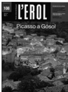
Portada l'Erol de Picasso

Pablo Ruiz Picasso (Màlaga, 1881 – Mogins, la Provença, 1973). Va residir una petita temporada a Gósol, l'estiu de 1906; no incloc cap referència, ja que per Internet es pot consultar tota l'obra berguedana, al número extraordinari de l'Erol 108, any 2011, http://www.raco.cat/index.php/Erol/issue/view/18189/showToc