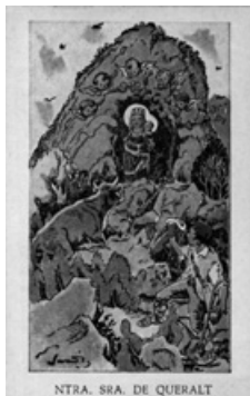
Queralt per Junceda color

La seva estampeta de Queralt fou feta vers els anys vint del segle passat, i crec que va ser estampada per ca l'Huch de Berga.