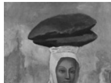
Picasso dona dels pans