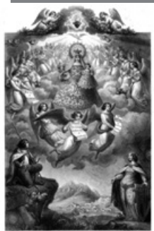
Miniatura impresa de la Santíssima Mare de Déu amb el fill Jesús, pintada per el Sr. Fortuny, de Berga